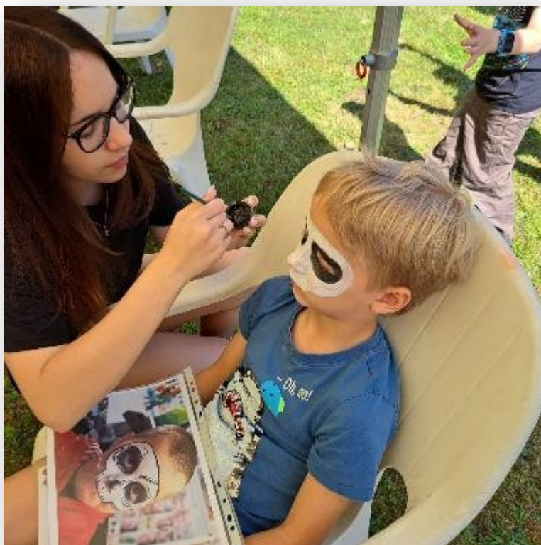
Obrázek 4: Den dětí 2024