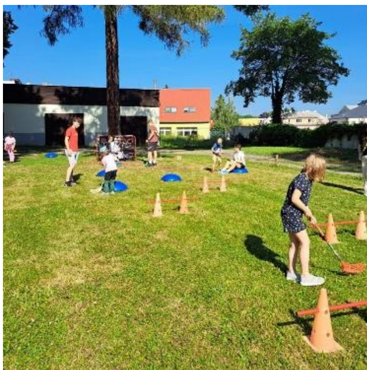
Obrázek 5: Den dětí 2024