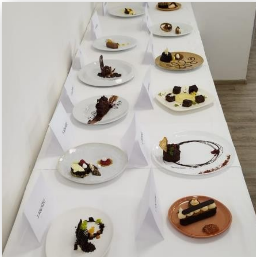
Obrázek 1: Marlenka CUP 2024

⇒ ÚZ 809 - Účelová dotace na „Podporu kvality odborného vzdělávání oboru Cukrář 2024“ – částka 52 000,- Kč s časovou použitelností od 1. 12. 2023 do 31. 08. 2024.