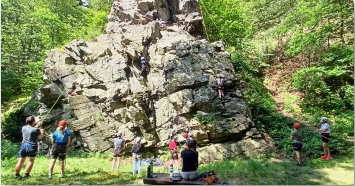
Obrázek 11: Sportovní kurz 2024