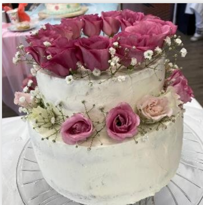
Obrázek 13: Závěrečné zkoušky oboru Cukrář