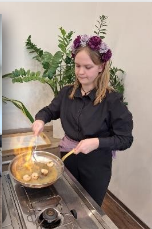
Obrázek 8: Praktická maturitní zkoušku oboru Hotelnictví