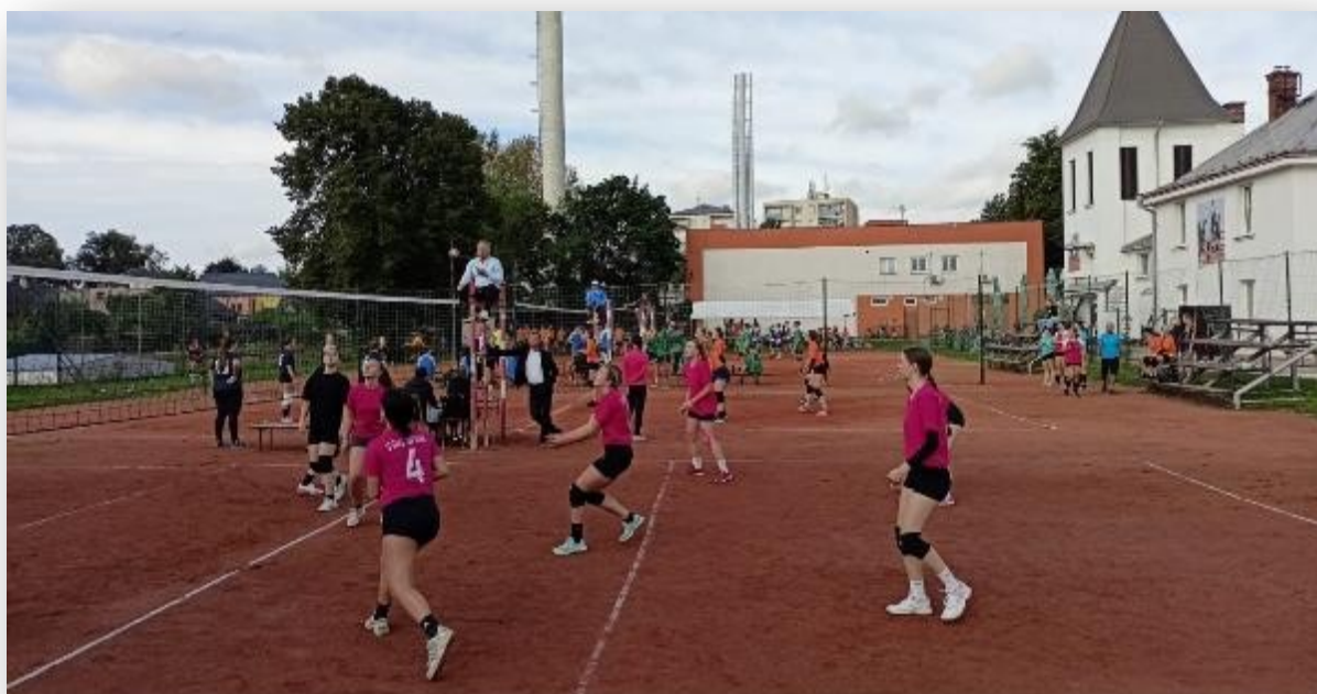
Obrázek 7: Memoriál Jana Martínka