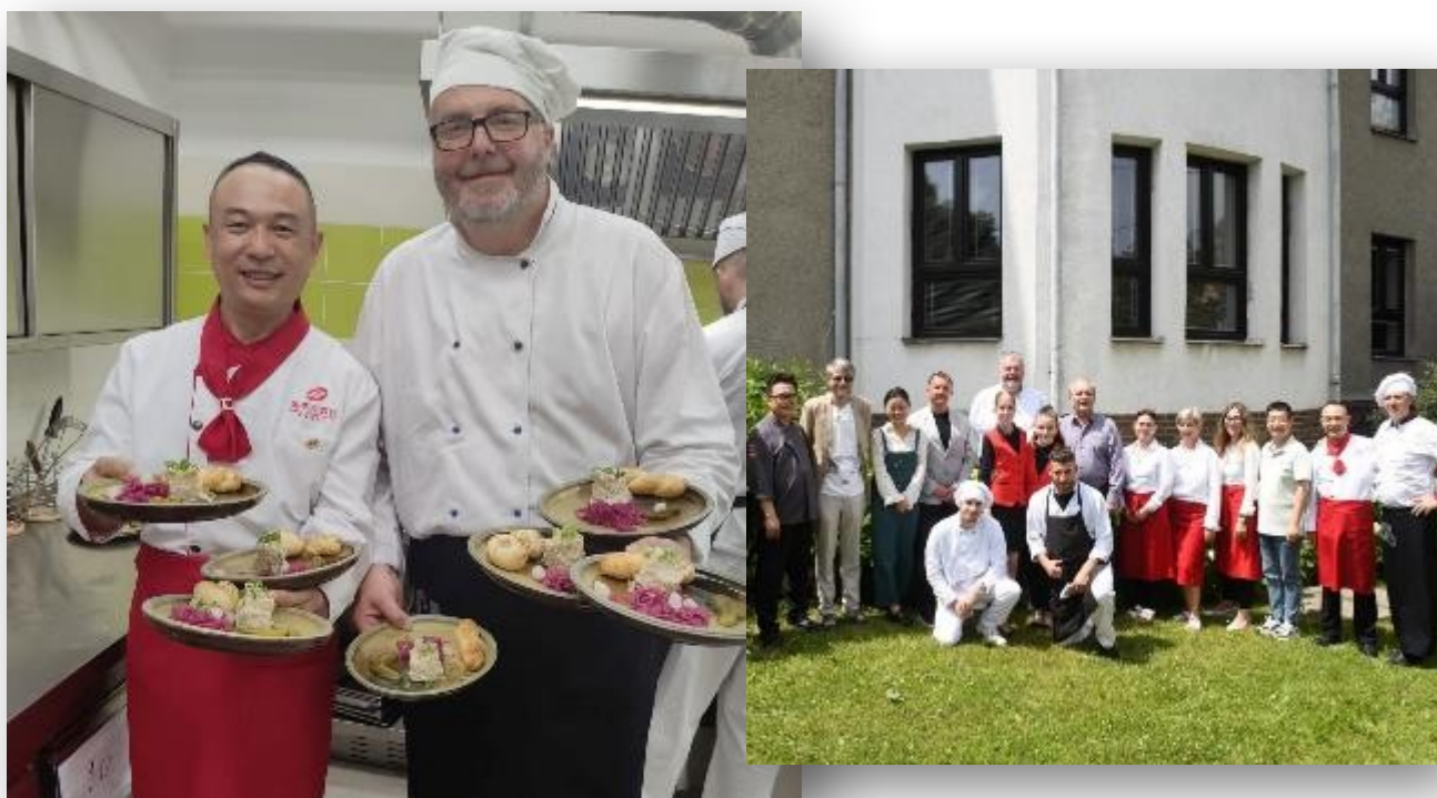
Obrázek 3: Návštěva delegace čínských kuchařů