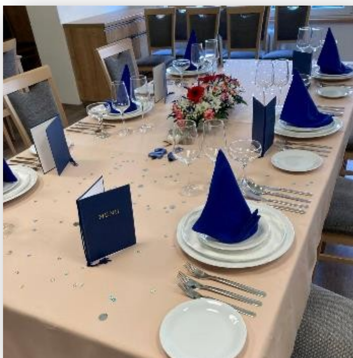
Obrázek 14: Závěrečné zkoušky oboru Kuchař-Číšník