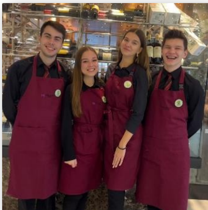
Obrázek 2: 21. ročník Brněnského vánočního poháru