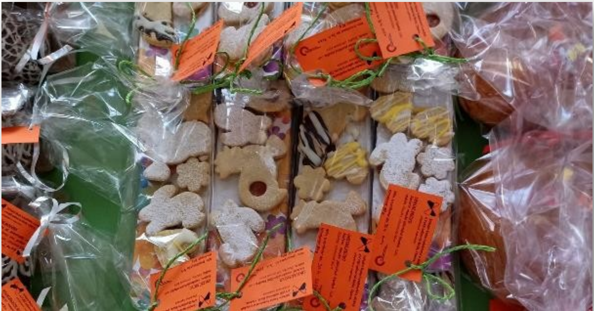
Obrázek 12: Učňovský Velikonoční jarmark