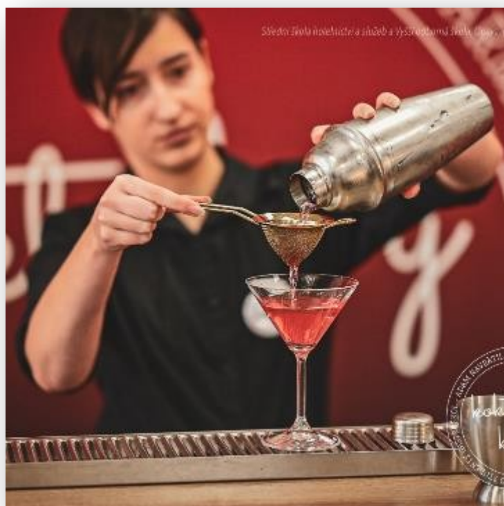
Obrázek 6: Koktejlový kurz